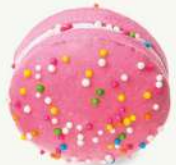
Macarrón fresa banana