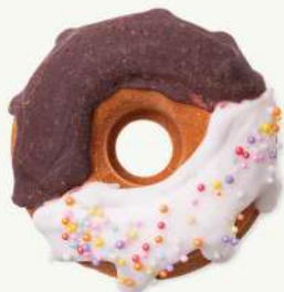
Dona chocolate vanilla