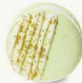
Macarrón pistache dulce y almendra