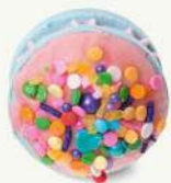
Macarrón birthday cake